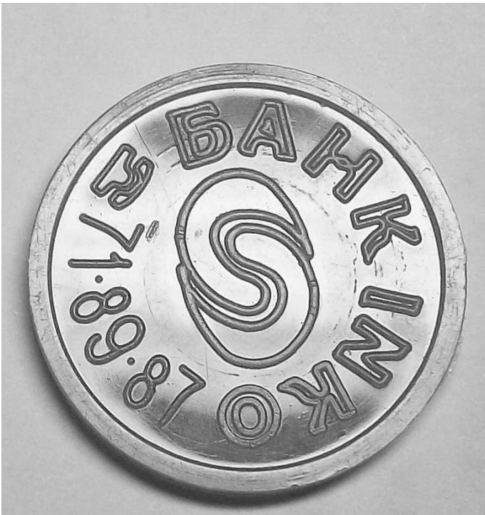
Тип 2.4(6) Треугольник буквы «А» правый угол ниже.