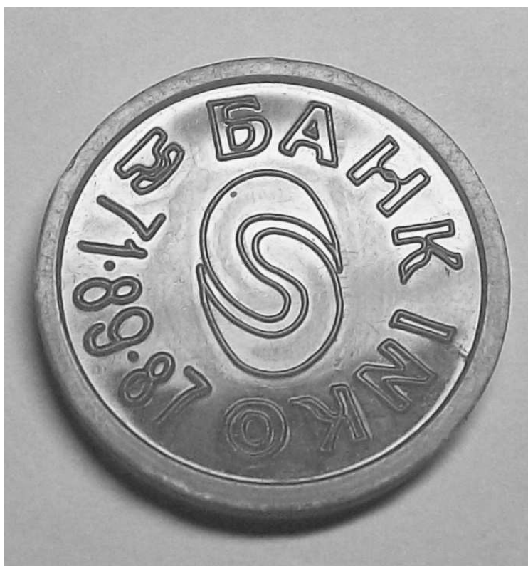
Тип 2.3(7) Треугольник буквы «А» - ровный треугольник.