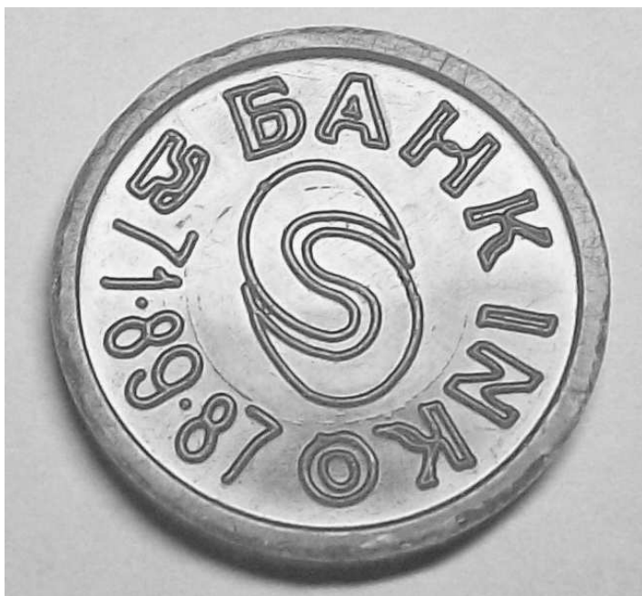
Тип 2.3(6) Треугольник буквы «А» - ровный треугольник. По полю формы имеются круговые полосы.