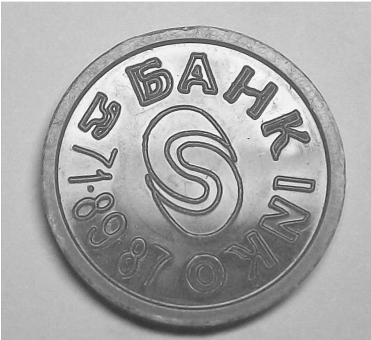
Тип 2.4(5) Треугольник буквы «А» правый угол ниже.