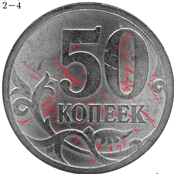
множественные следы шлифовки