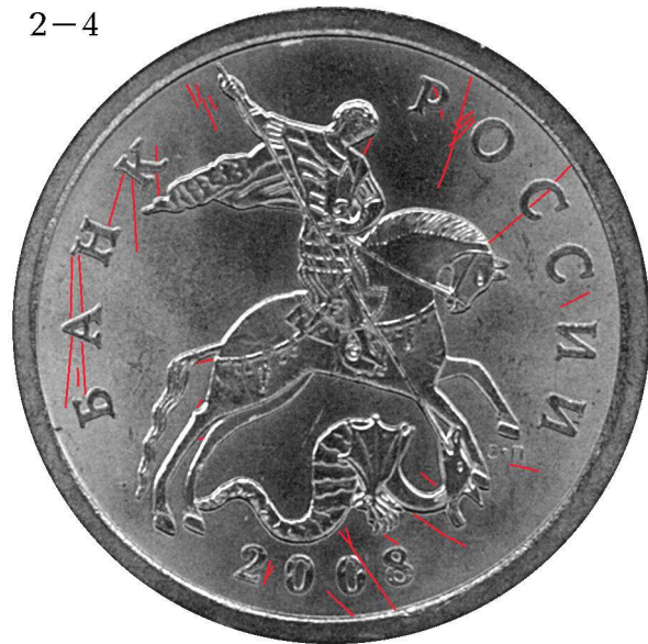
множественные следы, показаны не все